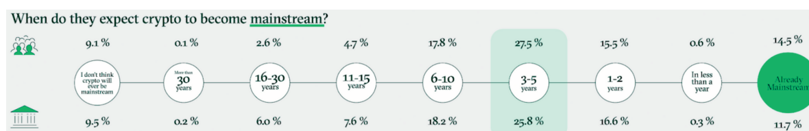
Réponses d'investisseurs institutionnels et particuliers à la question "À quel horizon estimez-vous que les crypto-actifs deviendront mainstream ?"

La technologie blockchain et les crypto-actifs semblent donc avoir acquis leurs lettres de noblesse auprès des experts comme du grand public, et leur adoption globale, déjà bien enclenchée, pourrait atteindre un point décisif dans les années à venir, dans la lignée d'applications toujours plus nombreuses et accessibles.